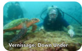
Vernissage: Down Under