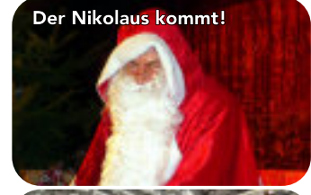
Der Nikolaus kommt!